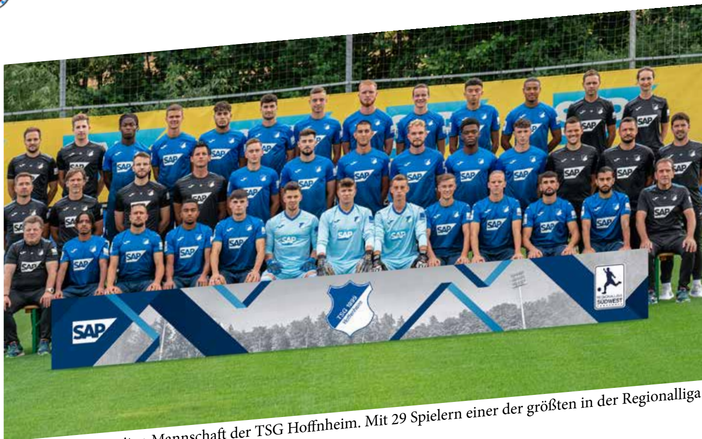
Der Kader der zweiten Mannschaft der TSG Hoffenheim. Mit 29 Spielern einer der größten in der Regionalliga