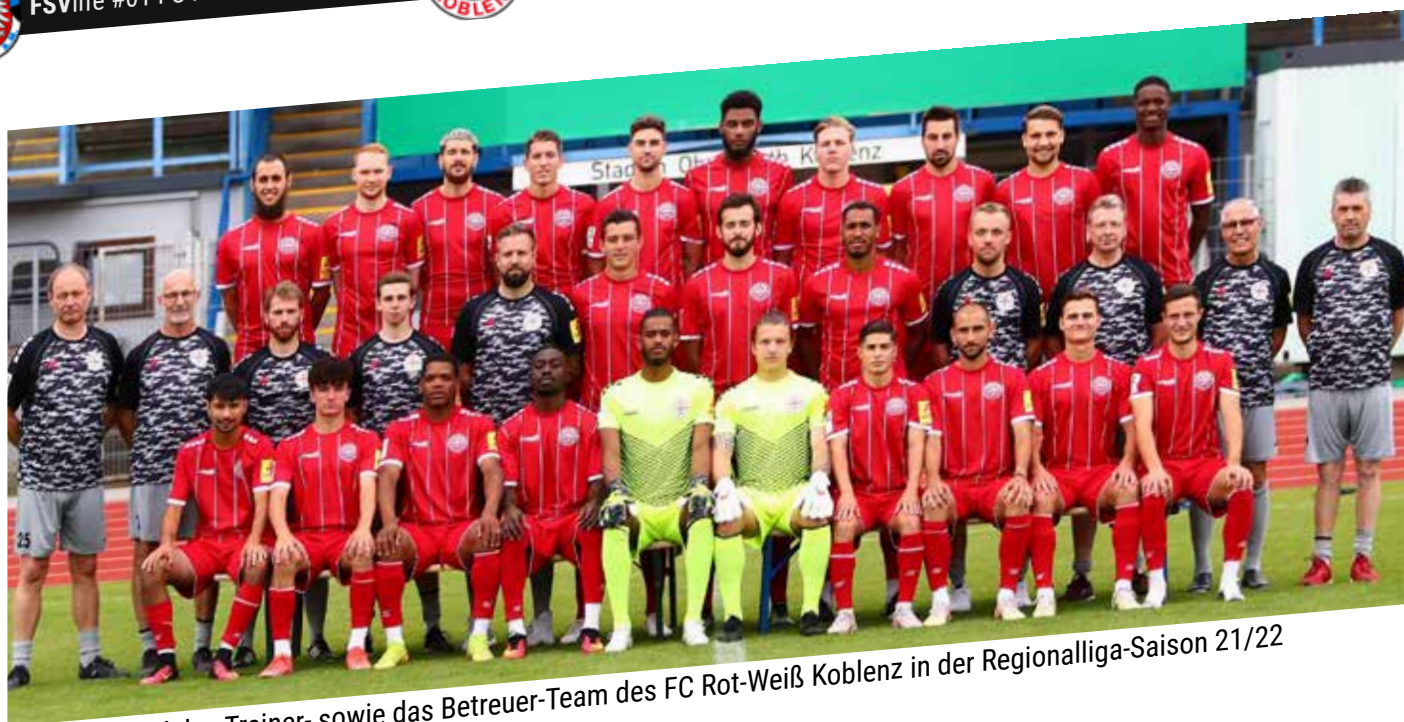
Der Kader und das Trainer- sowie das Betreuer-Team des FC Rot-Weiß Koblenz in der Regionalliga-Saison 21/22

mit 0:3 abgeben musste, bleibt ein Start in die Saison mit zwei Niederlagen 0:6 Toren.